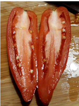
Andine de Fontenelles

Produit des tomates allongées et bien rouges. Leur chaire est charnue et contient peu de pépins. Cette variété résiste au cul noir.