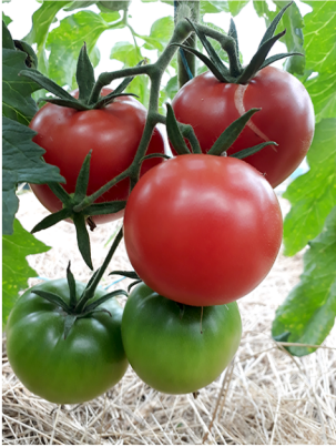
Rose de Berne

Beaux fruits très goûtus de couleur rose. Leur chaire est charnue, sucrée et peut même aller jusqu'à se déchirer à cause du sucre.