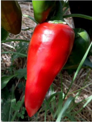
Poivron Rosso Duermilla

On l'appelle aussi « Piment doux ». Ses fruits sont de forme allongée au goût sucré et doux. Il ne pique pas. Bonne conservation.